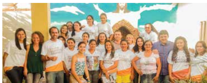
Polo de Confeção Solidário

O esporte pode mudar vidas. E é com esse objetivo que o Maré Alta vem apostando na promoção de escolinhas de bodyboarding, futsal, oficinas de artesanato e apoio pedagógico para 30 meninos e meninas da Taíba. O projeto atua no contra turno escolar e busca contribuir para o desenvolvimento educacional e social de crianças e adolescentes, fortalecendo a cidadania através do esporte e de atividades educacionais e culturais.