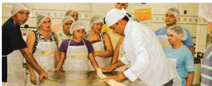
Trigo e Esperança

Entidade | Associação de Desenvolvimento Comunitário de Baixa das Carnaúbas - Essa ideia nasce do caju e resulta em diferentes produtos - bolo, doce, biscoito, cocada, mel - e também na geração de renda para 25 jovens e mulheres. O Pracaju vem promovendo a qualificação no manuseio e beneficiamento do caju por meio de cursos profissionalizantes e a construção de um centro de beneficiamento. O objetivo é incentivar a criação de cooperativa de jovens e mulheres, gerando renda na região de Matões, a partir de uma iniciativa comunitária.