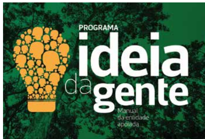
Capa do manual do beneficiário

Esse é apenas um exemplo de como uma ideia pode mudar a vida de uma pessoa, uma comunidade, um município. Nesta edição do CSP Notícias, apresentamos um balanço do primeiro ciclo do Ideia da