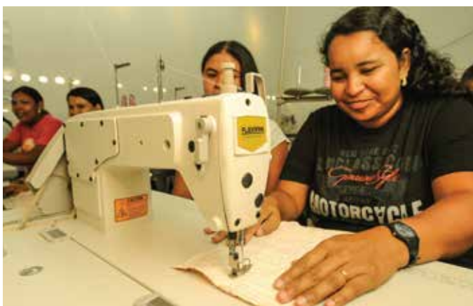
Lagoa das Cobras Confeções

Como o próprio nome sugere, a ideia da Asfap era contribuir para o futuro das crianças e jovens do Pecém através de um caminho que vai se abrindo por meio da educação. No primeiro ano de atividades, ofereceu cursos de Informática (manutenção e design) e de Inglês com 15 jovens sendo encaminhados ao mercado de trabalho. Também proporcionou apoio pedagógico a alunos do 5º ao 9º ano e lanche para as crianças e jovens beneficiários do projeto. Para isso, investiu em melhorias no espaço da associação e comprou computadores e material didático. Ações beneficiaram um total de 180 crianças e jovens.