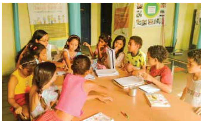
Caminhando para o Futuro