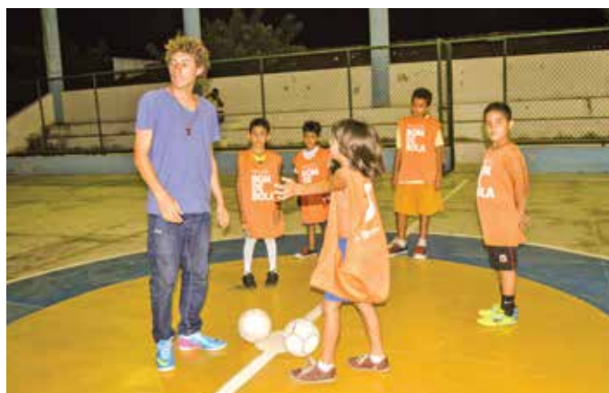
Bom de Bola e Criança na Escola

O público desse projeto são as muitas marias que vivem em situação de baixa renda na sede de São Gonçalo do Amarante. A proposta é gerar renda e empreendedorismo com a criação de uma cooperativa de prestação de serviços de limpeza residencial e comercial. O trabalho começou com a reforma do espaço destinado ao projeto e com a compra de mobiliário e equipamentos de escritório. A partir de então, as mulheres beneficiadas começaram a participar de cursos, alguns deles realizados a partir de parceria com o Senac, como o de associativismo, consultoria de gestão e agente de limpeza e conservação.